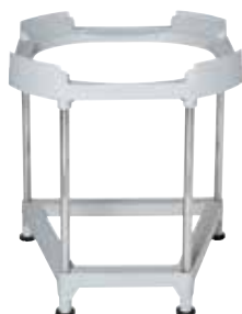
Trépied T.Flow® Nano