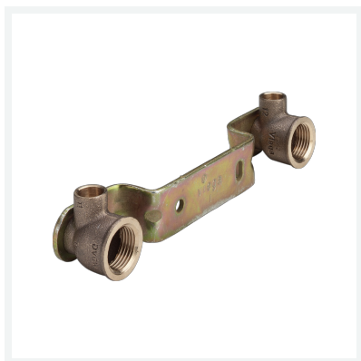
Gemini-Unité de montage modèle 94476.0 article 123 628