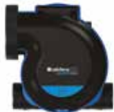
Groupe MW en vue de dessus